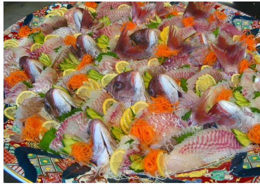
▲大皿に盛った天然マダいの刺身(無料試食用)

海の幸を「無料」で味わえる、お得なグルメイベント。 道の駅／萩しーまーと 開業9周年記念事業